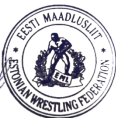
Г-н Яанус Паэвяли